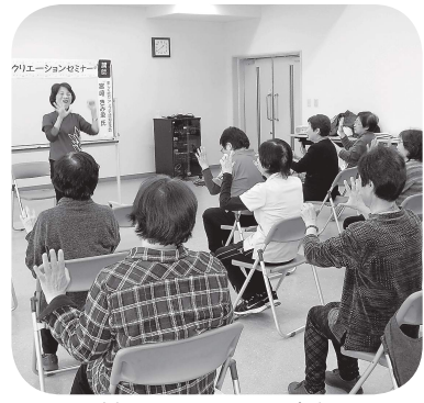
前回のセミナーより