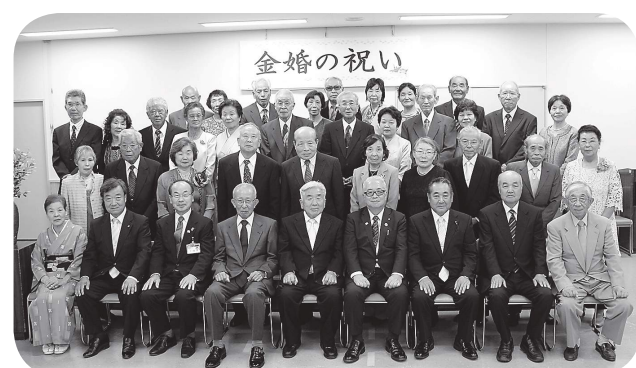
平成28年度「金婚の祝い」より